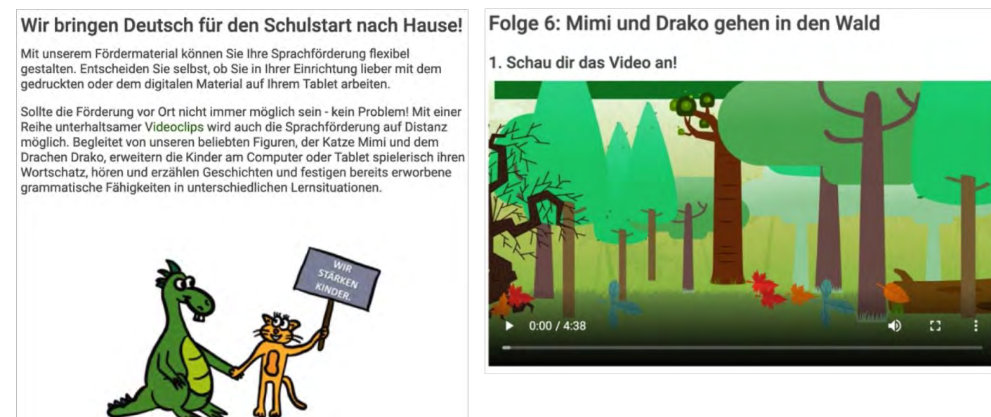
Spiele mit Mimi und Drako zu Hause