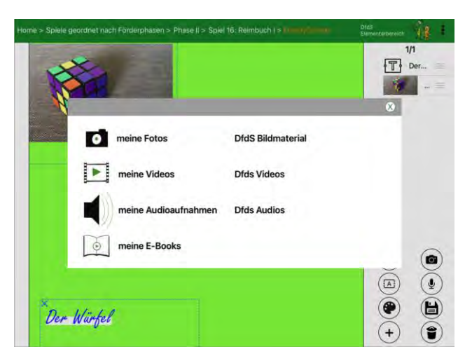
...mit vielen neuen Funktionen